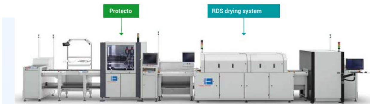
In-Line Conformal Coating Machines