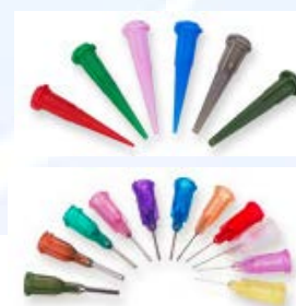
Aghi per dispensazione